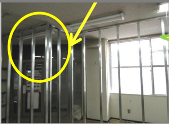
事務室内の出入口から潜入・・・

連日工事が続いている増築棟ですが、既存棟とつながる渡り廊下もでき、完成形に近くなってきました。これまで外からしか見られなかった増築棟に、今回初めてスタッフが潜入に成功！増築棟内部を少しだけお見せします。