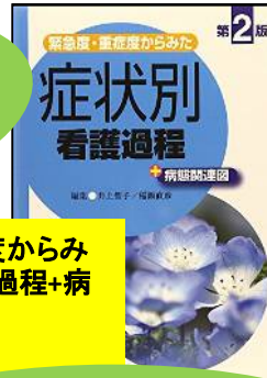
緊急度・重症度からみた 症状別看護過程+病 態関連図 WY/100/Kin