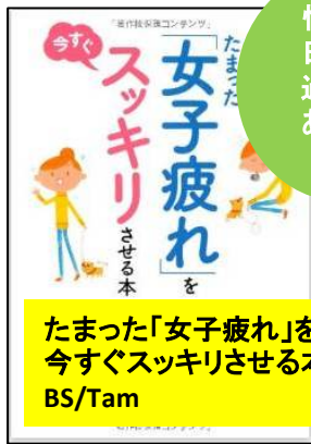
たまった「女子疲れ」を 今すぐスッキリさせる本 BS/Tam

日本人の知らない日本語:なるほ ど〜×爆笑!の日本語“再発見”コ ミックエッセイ 810.4/Nih