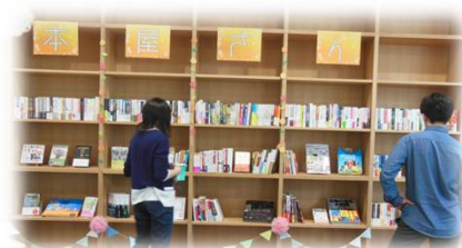
早速ご来店の学生さん

6月24～26日まで開催しました「ミニミニ本屋さんがやってくる！」にご来店(?)いただきました皆様、選書してくれた皆様、ありがとうございました。