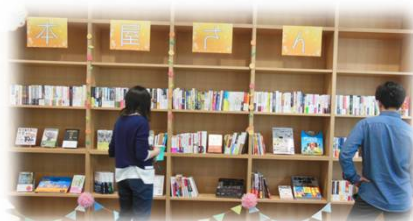
早速ご来店 of 学生さん

6月24～26日まで開催しました「ミニミニ本屋さんがやってくる！」にご来店(?)いただきました皆様、選書してくれた皆様、ありがとうございました。