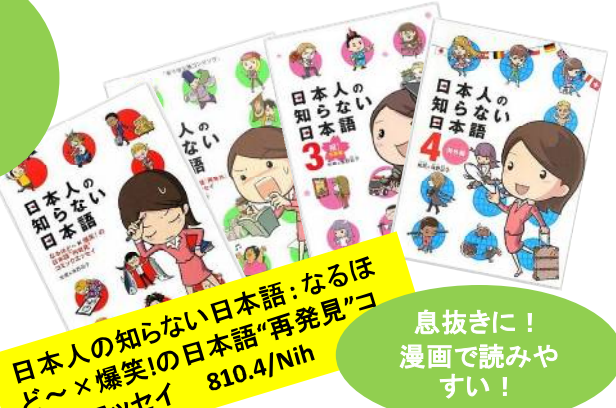
日本人の知らない日本語:なるほ ど〜×爆笑!の日本語「再発見」コ ミックエッセイ 810.4/Nih