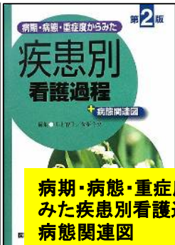
病期・病態・重症度から みた疾患別看護過程+ 病態関連図 WY/100/Byo

看護過程以外のときでも、疾患 や症状についての説明が盛りだ くさんなので、普段の講座や演 習、実習のお供にピッタリです！