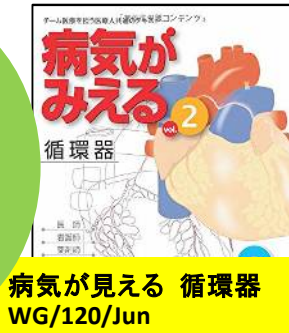
病気が見える 循環器 WG/120/Jun