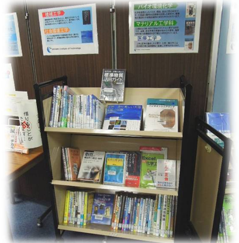
※写真は平成25年実施の様子です。

展示期間は、9月30日(水)～10月20日(火)を予定しています。カウンターで貸出も出来ますので、ちょうど試験も終わるこの時期、ぜひ手に取ってみてくださいね。お楽しみに！