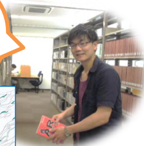
図・2F開架/ 一般教養 913.6/Ai

図書館を利用される 皆様のお役に立てる よう努めていきます。 最近の好きな本: 山本弘 『アイの物語』