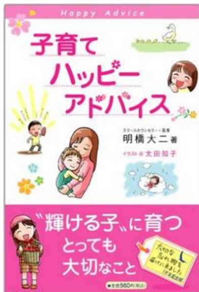
子育てハッピーアドバイス / 明橋大二著 ; 太田知子イラスト