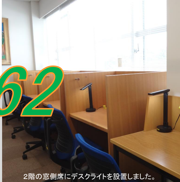
2階の窓側席にデスクライトを設置しました。