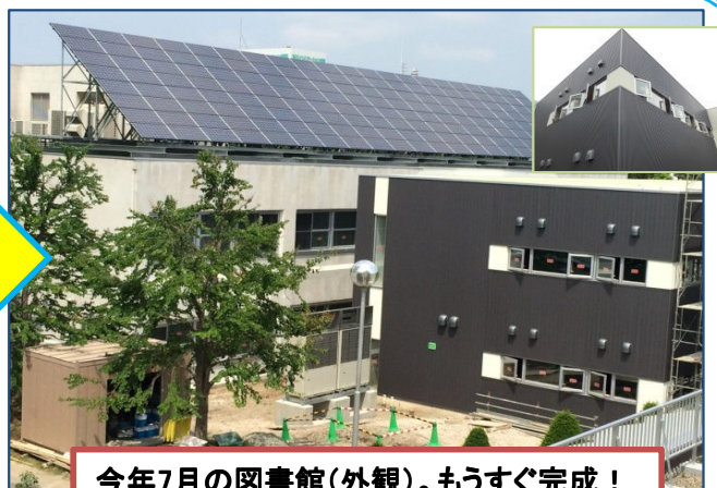
今年7月の図書館(外観)。もうすぐ完成！