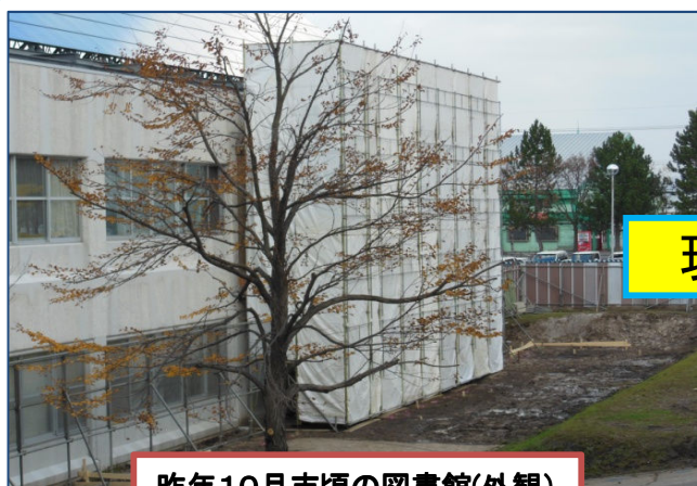
昨年10月末頃の図書館(外観)