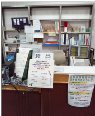
現在の図書館カウンター