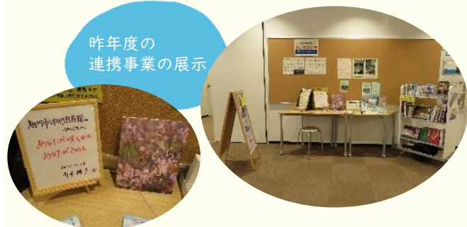
昨年度の連携事業の展示

昨年度は、旭川市中央図書館の蔵書を本学図書館に展示していただきましたが、今年度は本学図書館から旭川市中央図書館に出張展示を行います。